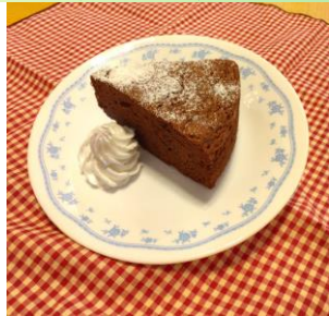
ガトーショコラ 300円