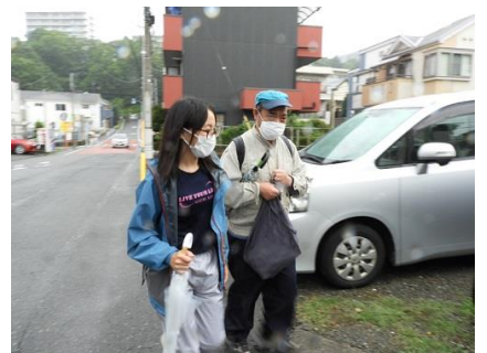
移動(いどう)支(し)援(えん)の(の)様(よう)子(し)

A. 水(すい)車(しゃ)の(の)よ(よ)う(う)に24時(じ)間(かん)回(わ)り(り)続(つづ)けて(て)地(ち)域(いき)の(の)人(ひと)を(を)支(し)え(え)る(る)とい(と)う理(り)念(ねん)は(は)受(う)け継(つ)ぎ(ぎ)づ(づ)つ(つ)、サ(サ)ービ(び)ス(ス)提(てい)供(こう)の仕(し)組(ぐ)み(み)を(を)改(か)革(かく)して(して)い(い)き(き)たい(たい)と思(おも)い(い)ます(す)。テ(テ)ーマ(ーま)は(は)「は(は)い喜(よろこ)んで(んで)!(!)」を(を)無(む)理(り)なく(なく)無(む)駄(だ)なく(なく)です(す)。ぜ(ぜ)ひご期(き)待(たい)下(くだ)さい。